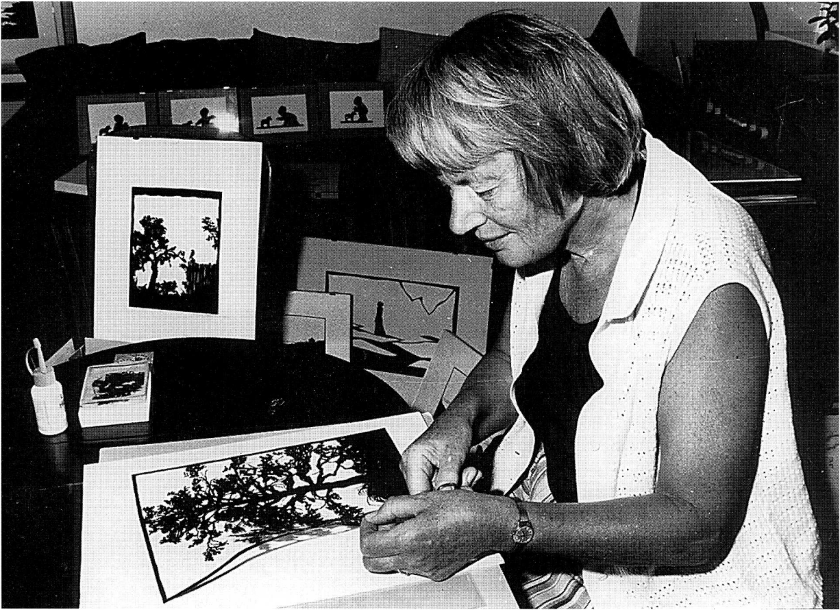
Gunhild Skovmand