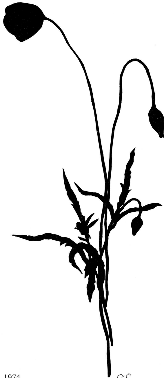
Draumsóley / Valmue, 1974 Einkaeign / Privateje