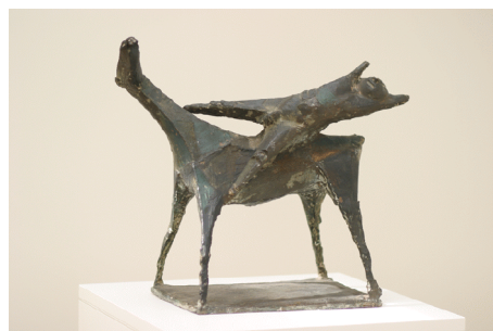
Marino Marini Litli knapinn 1950